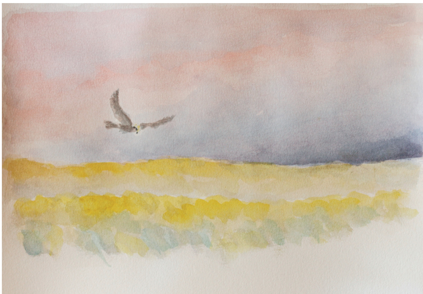
3.5. Rørhøgen, hunnen på jagt over rapsmarkerne.

Efter en lidt kraftig opstigning lander du oppe på Tjærebyvej. Turen går tilbage mod start. Tårnborghallen ved Tårnborg Skole.