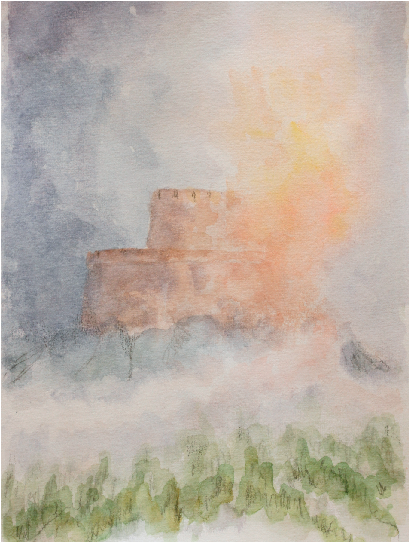
3.3. Et øjeblik kan du i fantasien måske se konturerne af den gamle borg.