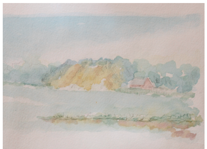
3.2. Ude i det fri igen. Haneklint. Et efterladenskab fra istiden.