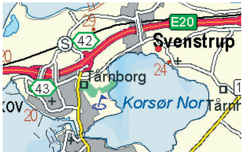
Oversigtskort. Den store røde prik viser turens udgangspunkt.