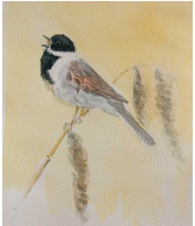
3.4. Du kan også her se og høre rørspurven ude i sivene.