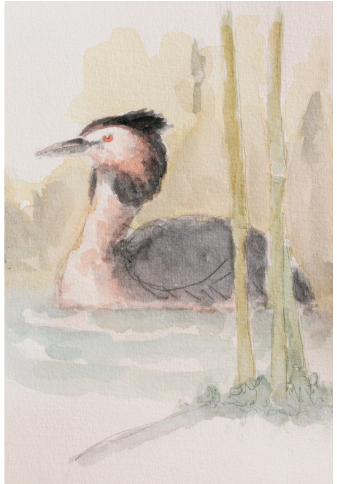
3.1. Den toppede lappedykker i yngledragt.

Jeg vil foreslå, at du sætter dig en stund (4). Lægger trafikken fra vejene bag dig. Tager en tår at drikke. Slapper af. Får pulsen ned, mens du suger udsigten til dig. Du kommer i et andet mode.